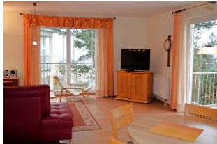
Blick in das Wohnzimmer und zum Balkon.