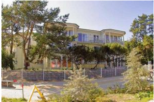
Blick von der Promenade zum Objekt.

Direkt an der Ortsgrenze Heringsdorf / Bansin gelegen, entstanden im Jahr 2002 zwei Strandvillen auf einem ca. 3.300 qm großen Grundstück mit altem Baumbestand und direkter Ostseelage. Das Appartement liegt im 2. Obergeschoss mit großzügiger Ausstattung und einem herrlichen, freien Blick auf die Ostsee. Hier wohnen Sie in der ersten Reihe und können die Aussicht vom Balkon oder Wohn- und Schlafzimmer genießen. Ein Parkplatz für das Fahrzeug rundet das Angebot ab.