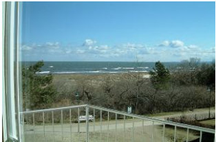
Balkon mit freiem Ostseeblick.