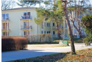
Blick von der Promenade zum Balkon oben rechts.