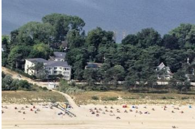
Luftbild von der Ostsee. Im Hintergrund liegt der Schloensee.

Ostseebad Heringsdorf, Maxim-Gorki-Str. 36